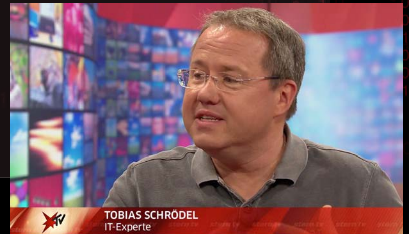
Tobias Schrödel, bekannt aus